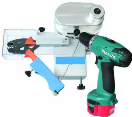
Handwerkzeug- Antrieb mit Akku- schrauber Crimping tool drive with power drill